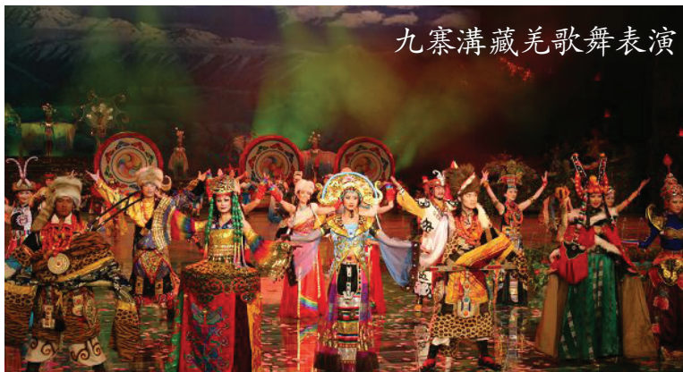
九寨溝藏羌歌舞表演

早餐後，遊覽有“童話世界”、“人間仙境”之譽的【九寨溝風景區】。九寨溝的湖泊，瀑布，雪山和原始森林，美景相映，組合成神妙、奇幻、幽美的自然風光，顯現“自然的美、美的自然”。九寨溝的高峰、彩林、翠海、疊瀑和藏族風情被成為“天下五絕”。晚餐後欣賞【九寨溝藏羌歌舞表演】（自費）。