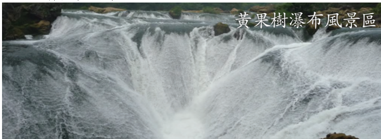
黃果樹瀑布風景區

早餐后游览【黃果樹瀑布風景區】(含景区环保观光车和单程观光扶梯)，黃果樹瀑布是一非常巨大的瀑布群體。黃果樹瀑布是中國第一大瀑布，也是亞洲最大的瀑布。游览【天星橋風景區】是由地下河塌陷形成，寬約300公尺的『天生橋』。游览【銀鏈墜瀑布】實際上是漏斗形瀑布，位於水上石林左上方。銀鏈墜潭瀑布由於長年累月的波浪衝擊和流水侵蝕，是個奇特的景觀。沿途游览【石頭寨】(车观)，随后返回貴陽，晚餐后欣赏【多彩貴州風】（自费）由21個節目組成，包括苗、侗、瑤、土家等7個民族的歌舞，其中既有獲得國家級大獎的《侗族大歌》，也有來自田間地頭的原生態藝術瑰寶，還有從遠古流傳至今的民族習俗和民間絕技。